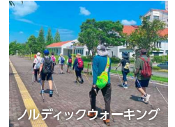
ノルディックウォーキング