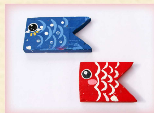
「こいのぼりを作ろう」作品例