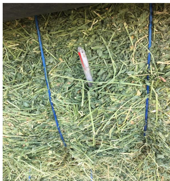
(アルファルファ2番刈 コロンビアベースン 7月下旬撮影)