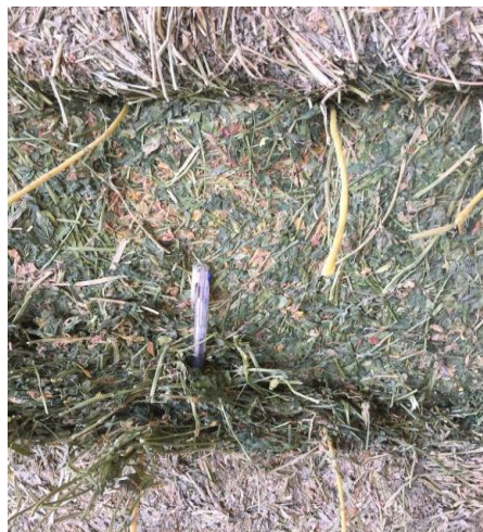
(アルファルファ 1 番刈 ネバダ州中西部 7月下旬撮影)