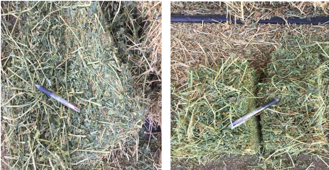
(アルファルファ1番刈 左：クリスマスフォールズ産 右：クリスマスバレー産 7月中旬撮影)

クリスマスバレーでは1番刈の収穫作業は終了しており、2番刈の収穫が開始しています。1番刈は収穫期に好天に恵まれことから、上級品が多く発生しています。一方コロンビアベースン産1番刈の不作を受け、高成分品を求める米国酪農家や輸出業者が旺盛に買付けを行っており、産地価格は高騰しています。